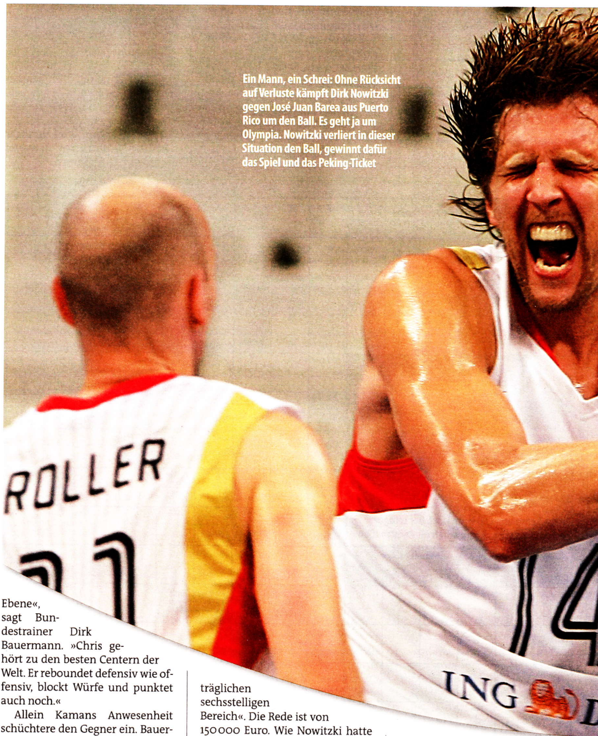
Ein Mann, ein Schrei: Ohne Rücksicht auf Verluste kämpft Dirk Nowitzki gegen José Juan Barea aus Puerto Rico um den Ball. Es geht ja um Olympia. Nowitzki verliert in dieser Situation den Ball, gewinnt dafür das Spiel und das Peking-Ticket

Es war aber nicht nur Yoga, was Kaman, der deutsche Urgroßeltern hatte, mit ins deutsche Team brachte. »Er hebt uns auf eine andere